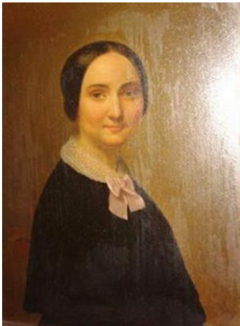
Figura 2: pintura à óleo de Berthe muito antes de chegar a Paris e se tornar espírita.