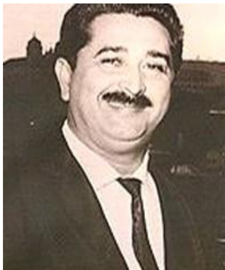
José Pedro de Freitas - (Zé Arigó)